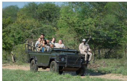
Safari im offenen Jeep