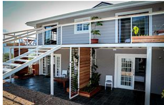
Außensicht Mogi Boutique Hotel