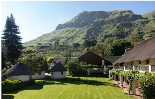
Berge im Hintergrund

(62 Zimmer: Bad/WC, Safe, Kaffee/Teezubereiter, Balkon oder kleine Terrasse. Hotel: Pool, Restaurant, Terrasse, Spa, Bar, sicheres Parken, diverse Sportmöglichkeiten)