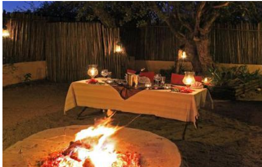
Dinner unter freiem Himmel

(10 Zimmer: Bad/WC, Klimaanlage, Kaffee-und Teezubereitung, Safe, Terrasse. Lodge: kleiner Pool, Restaurant, Lounge)